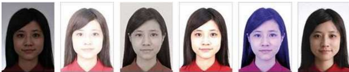
Muito escuro Muito claro Saturação muito baixa Contraste muito alto A cor da pele do usuário não está fiel Sombra no rosto