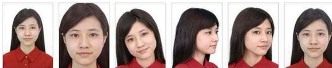
Rosto com proporção menor que 2/3 da imagem Rosto com proporção maior que 2/3 da imagem Cabeça inclinada Corpo de lado Rosto de lado Rosto não centralizado