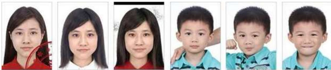
Carimbo na imagem