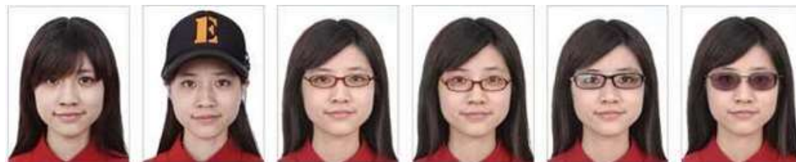
Franja cobrindo o rosto Boné cobrindo parte do rosto Óculos de aros grossos Óculos cobrindo os olhos Óculos refletindo a luz Lente dos óculos coloridas