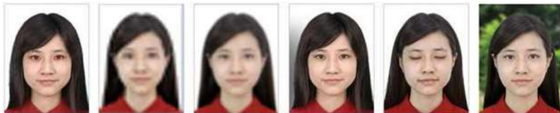
Olhos vermelhos Resolução muito baixa Imagem borrada Sombra no fundo da imagem Olhos fechados Fundo escuro e com muitos elementos