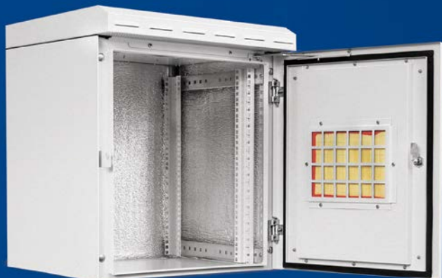
• Gabinete poste/parede.